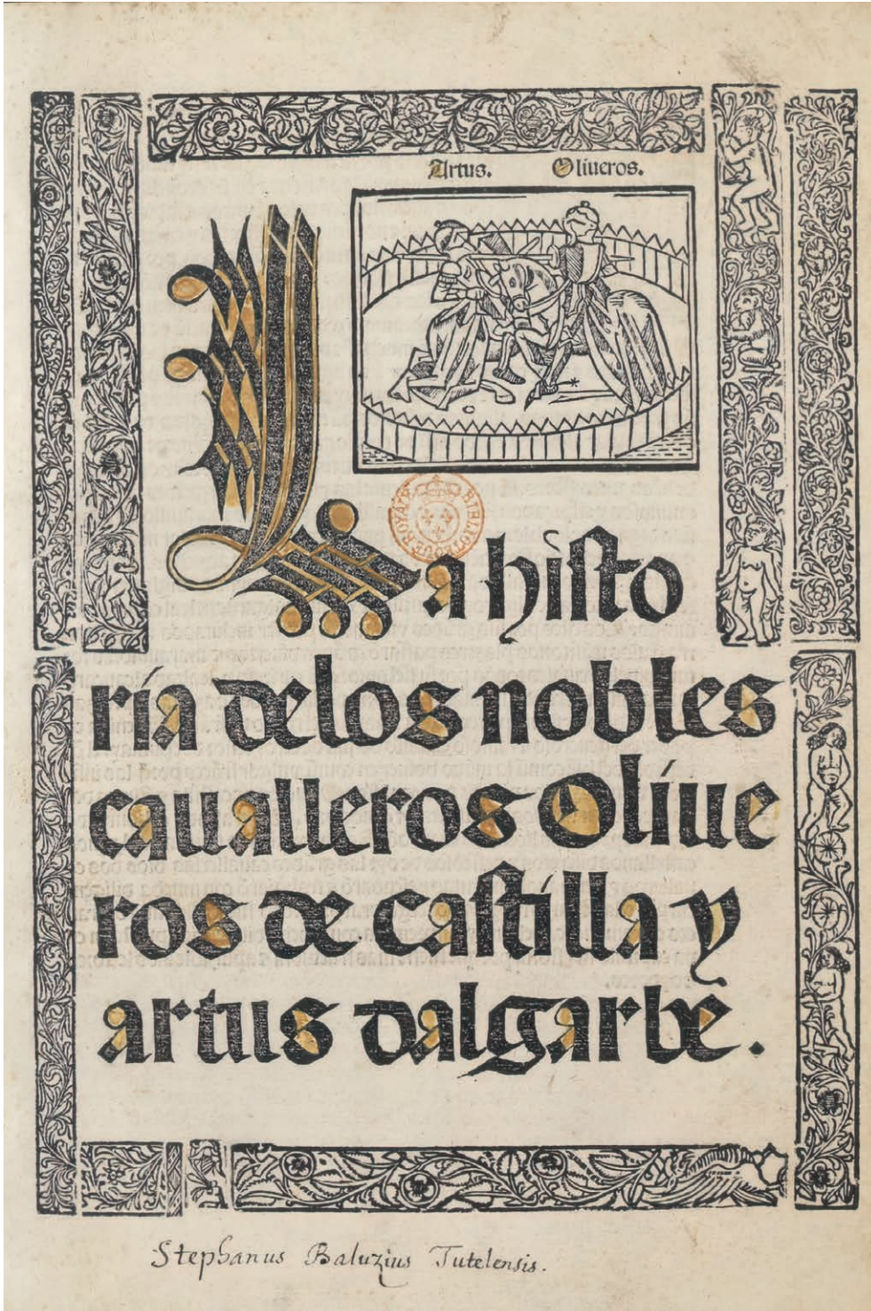
Fig. 5. La historia de los nobles cavalleros Oliveros de Castilla y Artus d'Algarbe , Sevilla, Juan Cromberger, 1507. Paris, BnF, RES-Y2-244, f. 1r.