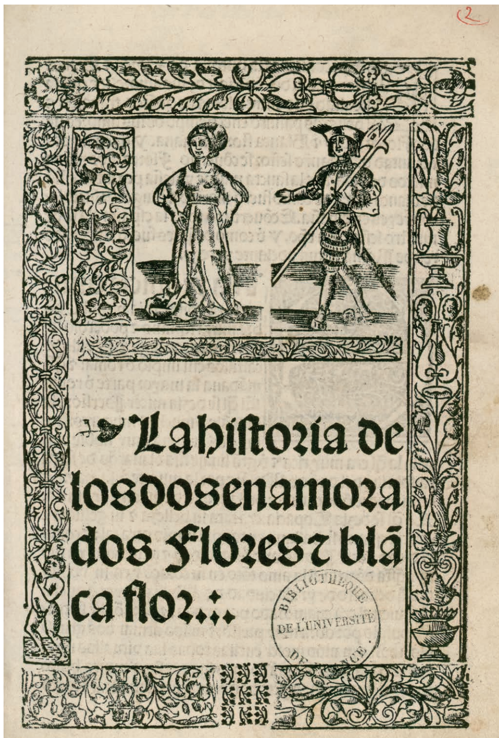
Fig. 3. La historia de los dos enamorados Flores e Blancaflor , Sevilla, Juan Cromberger, 1532, f. 1r. Bibliothèque interuniversitaire de la Sorbonne, cote RXVI 879. Cliché Bibliothèque de la Sorbonne https://nubis.univ-paris1.fr/ark:/15733/1k18/1 . NuBIS, consultato il 23 aprile 2021.