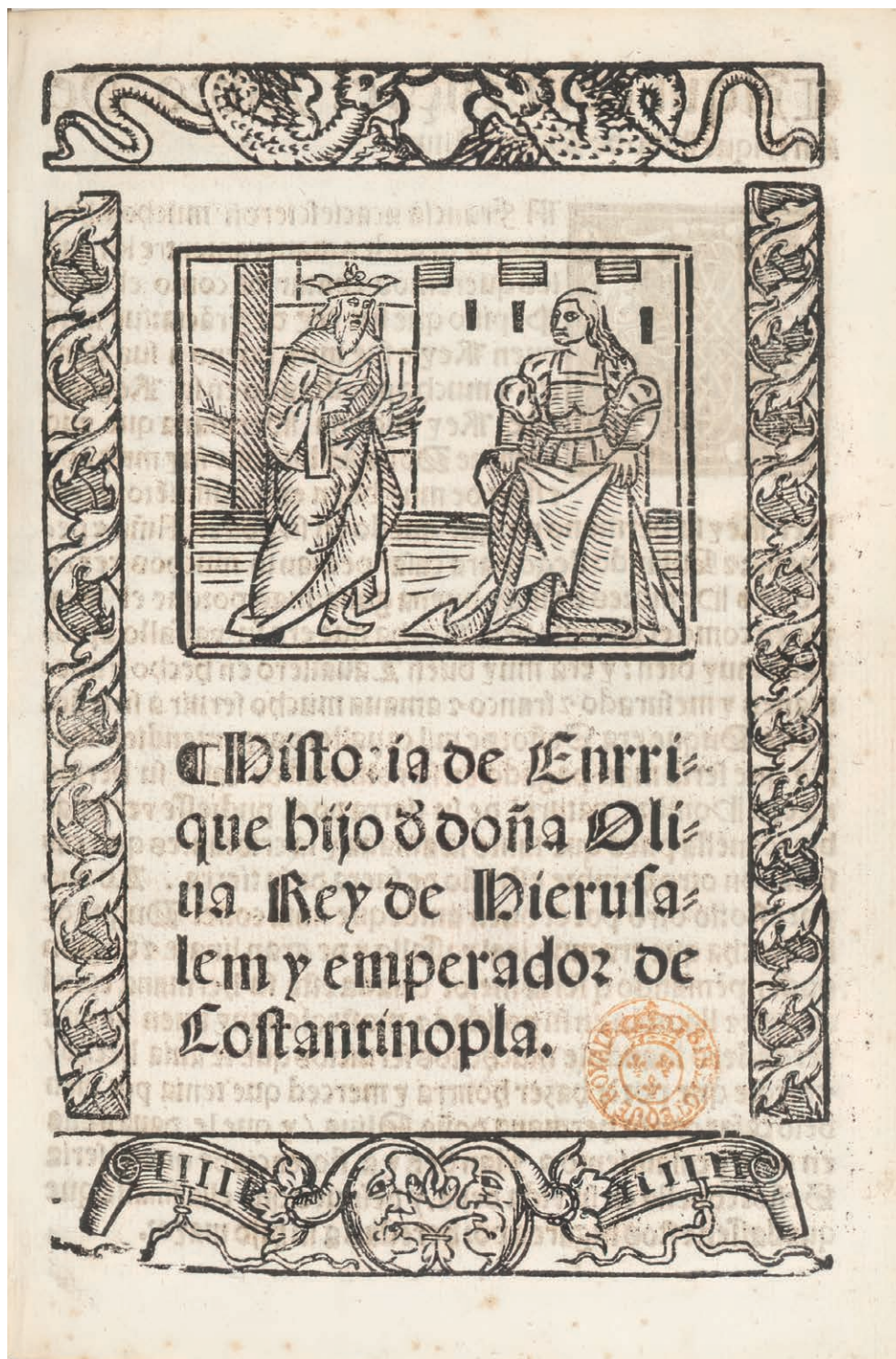
Fig. 2. La Historia de Enrique hijo de doña Oliva , Sevilla, Dominico de Robertis, 1545 Paris, BnF, RES-Y2-818, f. 1r.