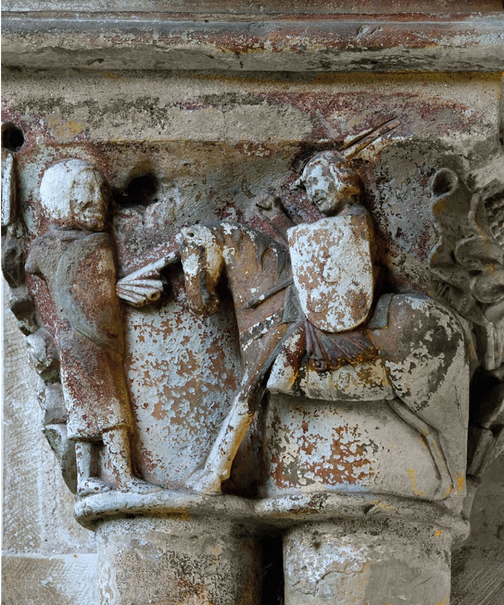
Fig. 6. Santiago Cavaleiro de Cristo . 2.ª metade do séc. XIII. Capitel do claustro da abadia de Santa Maria de Celas, Coimbra.

leiro a matar os mouros, mas a assumir-se perante uma assembleia, cristã e orante, como um paladino da luta contra o Islão).