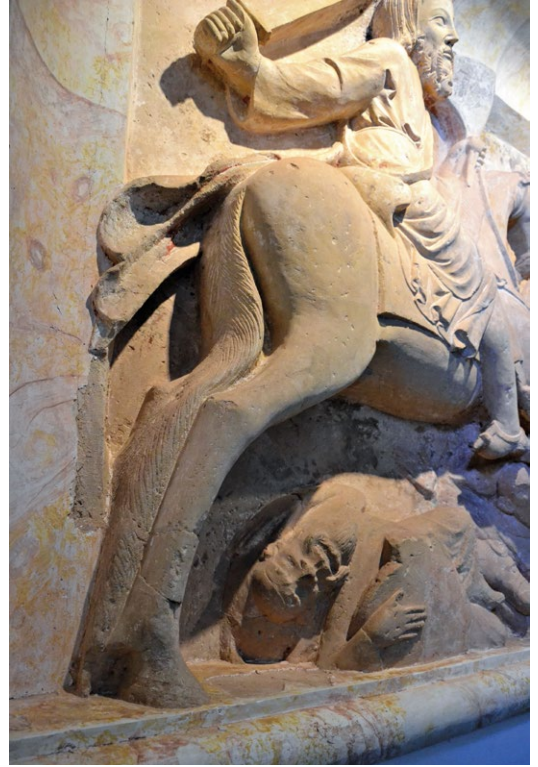
Figs. 9 e 10. Detalhes do cavalo e do da figura de Santiago.

chega mesmo a alcançar o espaço da moldura, ao nível da extremidade do estandarte que o santo segura com uma das mãos ou das patas traseiras do cavalo que este monta.