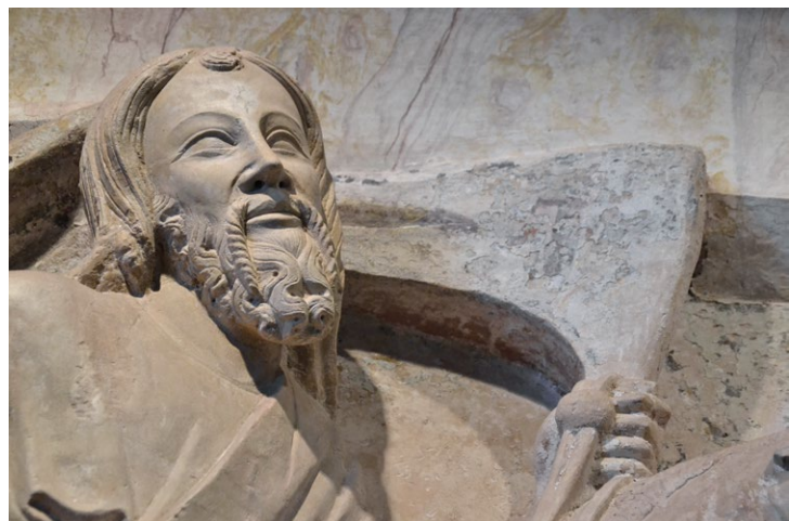
Figs. 11 e 12. Detalhes da imagem equestre de Santiago com espada e estandarte.

identifica as hostes cristãs (e onde antes esteve pintada, de forma visível, a Cruz da Ordem de Santiago de Espada, símbolo da Ordem, que hoje apenas se percebe com dificuldade) e que é também o estandarte que efectiva a ideia de vitória. (Figs. 11 e 12)