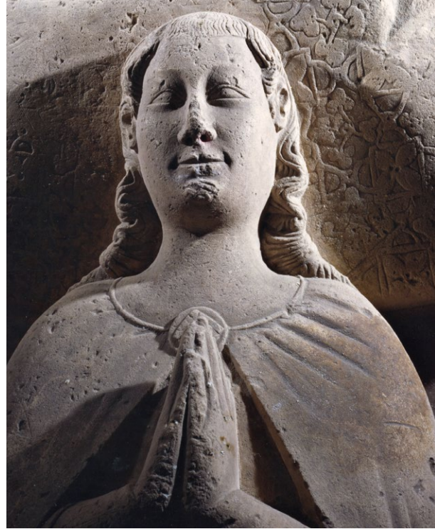
Figs. 16 e 17. Rosto da figura de Santiago no retábulo de Santiago do Cacém e rosto do jacente do infante D. João. Foto: PAF.

do tratamento dos tecidos e dos modelos das indumentárias das figuras masculinas de mestre Pero. (Figs. 16 e 17)