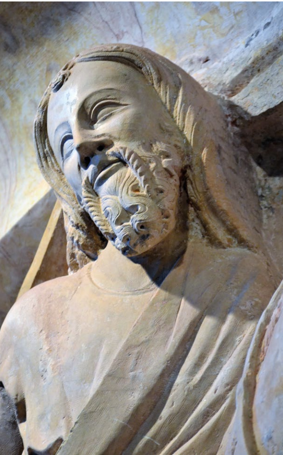
Fig. 15. Rosto da figura de Santiago.

ao momento com o nome deste mestre escultor. Não é possível afirmar que o túmulo do infante D. João e o retábulo de Santiago do Cacém são obras saídas do cinzel do mesmo escultor, mas não posso deixar de salientar a existência de semelhanças evidentes. Repare-se na caracterização dos olhos, rasgados, ligeiramente curvos na linha superior e quase rectos na linha inferior; nariz estreito e narinas salientes; boca com lábios bem mais carnudos do que aqueles que encontramos na modelação das bocas das figuras atribuídas a Mestre Pero; cabelos longos e escorridos, com as madeixas marcadas por estrias profundas e lineares e uma pequena madeixa de caracóis que cai sobre a testa (um artifício que encontramos em alguma imaginária do século XIV, como nos evangelistas dos cantos do claustro da catedral de Évora, por exemplo) mas não nas figuras da mão de mestre Pero, ou nas que lhe são atribuídas (e são muitas); o tratamento simplificado e fluído dos panejamentos, com idêntico decote debruado, redondo e largo, e com pregueados pouco angulosos e sem recurso a acrescentos decorativos, também diferentes