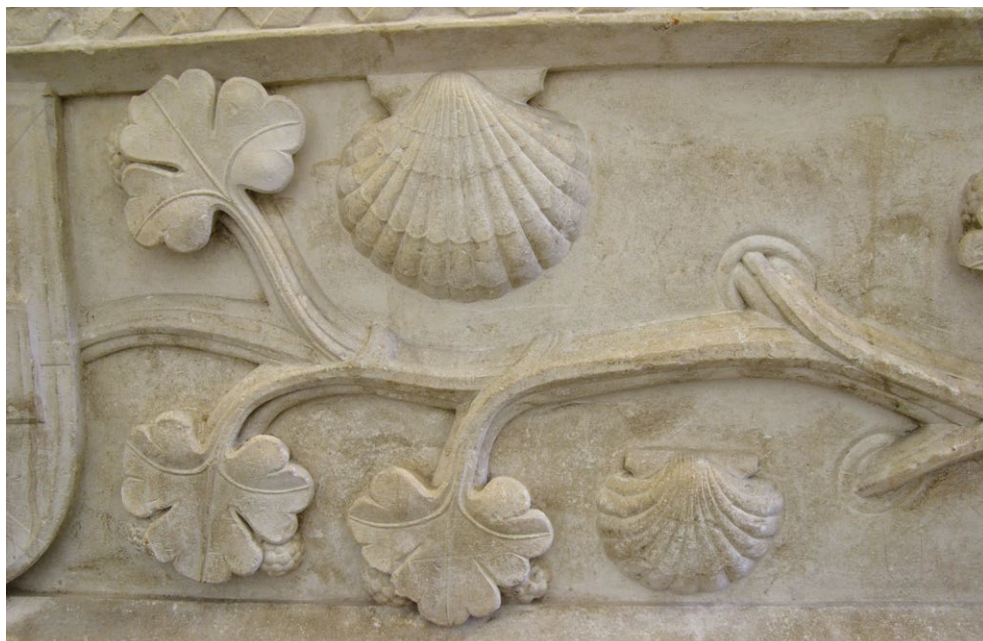
Fig. 4. Detalhe das vieiras na outra face do sepulcro de D. Rodrigo Sanches. Ca. 1345-47. Mosteiro de S, Salvador de Grijó.

fia do túmulo de Rodrigo Sanches, em particular a esta face do sarcófago 8 e tornou-o, juntamente com outros temas aí representados uma obra dos anos finais da arte dita românica em território português. (Fig. 4)