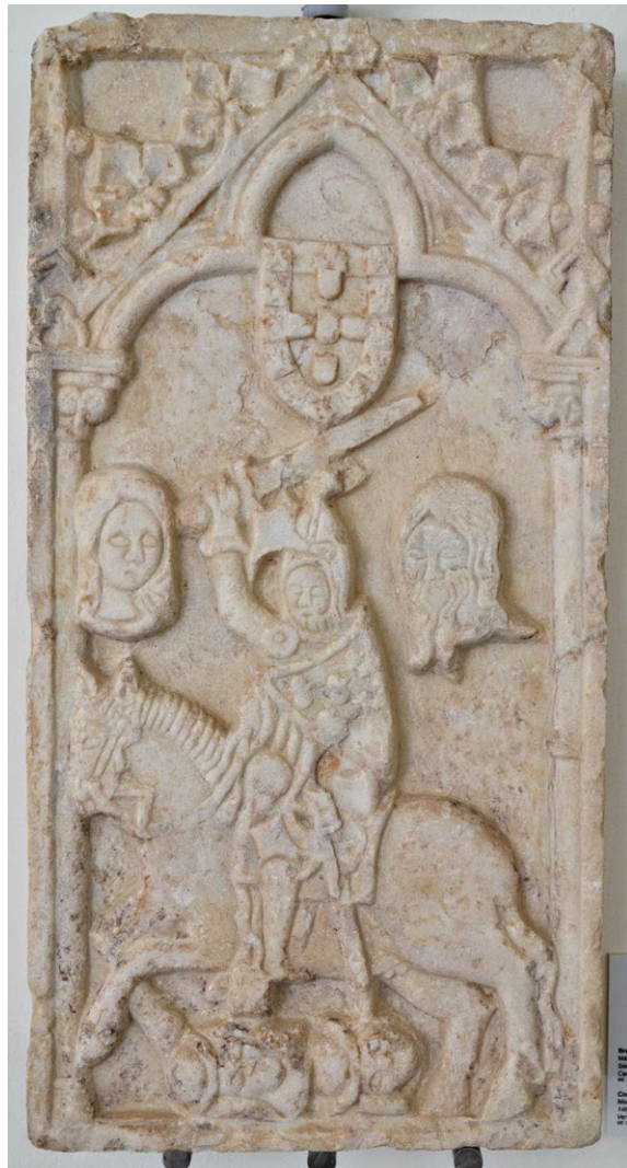
Fig. 18. Brasão de Armas da Cidade de Évora com possível representação de Santiago Matamouros. Séc. XIV. Mármore esculpido em baixo-relevo. Museu Nacional Frei Manuel do Cenáculo, Évora, Inv. N.º ME 1744. Foto: PAF.

Se esta cena representasse Geraldo Sem Pavor num momento de combate e de vitória sobre os muçulmanos, então a heráldica do escudo do cavaleiro decorado com vieiras não faria sentido, uma vez que o caudilho nunca foi membro da Ordem e, no século XIV, época em que este relevo foi feito, sabia-se bem quem tinham sido os mestres e cavaleiros da ordem de Santiago. O que parece ter acontecido neste relevo que é o brasão de armas da cidade de Évora é que este pode ter evoluído de uma imagem que representava um cavaleiro a combater (um conquistador – provavelmente Geraldo sem Pavor), para se assumir, depois, que esse cavaleiro era o próprio Santiago, conferindo à conquista de Évora um carácter de intervenção divina e fazendo com que este santo ficasse para sempre ligado à sua história. Assim, e neste caso, já