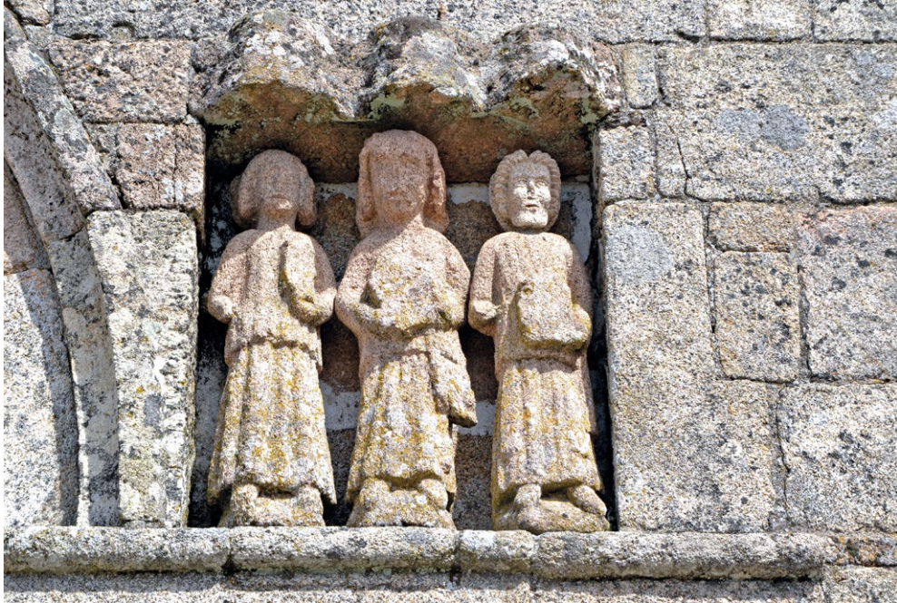
Fig. 5. Imagem de Santiago do antigo portal da igreja paroquial de Sernancelhe. Séc. XIII-XIV.

parte da organização compositiva e iconográfica do primitivo portal. No referido estudo identifica-se o santo, diferenciado dos outros apóstolos, que apenas seguram os respectivos livros dos Evangelhos, enquanto ele associa ainda a presença da esmoleira (escarcela) com vieiras na face voltada para o exterior. Pode tratar-se da mais antiga representação de Santiago que se conhece em Portugal, mas também pode ser contemporânea (em décadas) do capitel com Santiago Cavaleiro de Cristo da abadia de Celas, Coimbra (2. a metade do século XIII) ou até mesmo da primeira metade do século XIV, uma vez que rusticidade da sua esculturação (fruto não apenas da mão artística pouco adestrada que talhou estas figuras, mas também por usar como material o granito da região, e não o dúctil calcário de Coimbra) dificulta, e muito, uma proposta cronológica. (Fig. 5)