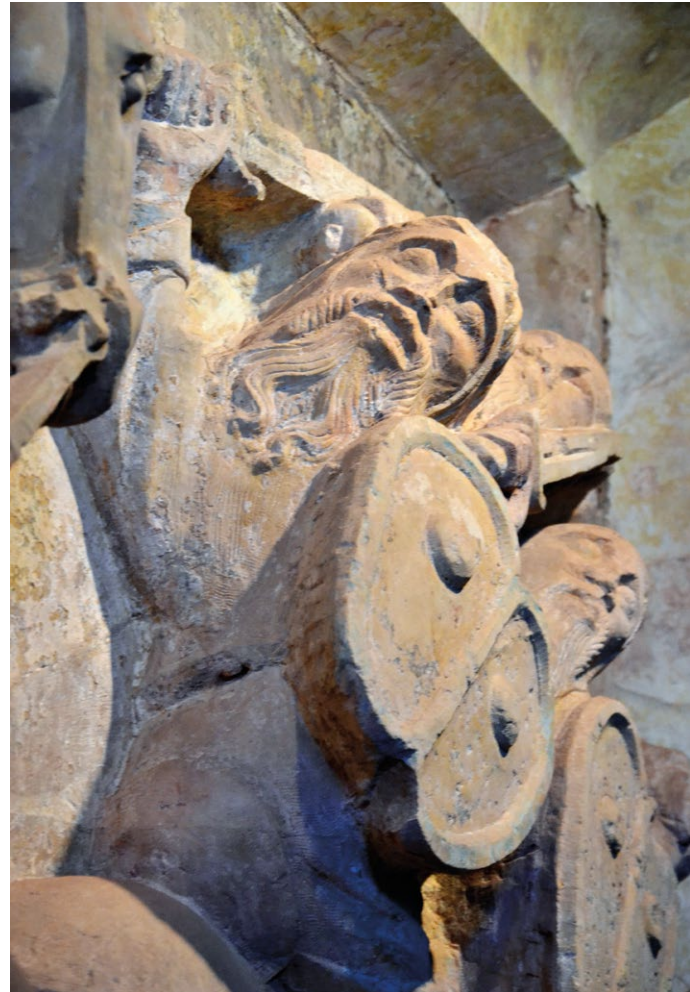
Figs. 13 e 14. Representação dos cavaleiros muçulmanos em fuga e outros submetidos sob as patas do cavalo.

túmulos de filhos ilegítimos de D. Dinis, relaciona-se com o valor formal dos mesmos, isto é, com a capacidade por parte dos artistas que os esculpiram de representar cavalos com proporções elegantes, figuras esguias e em pleno movimento. Ora, a única representação equestre que a historiografia da arte portuguesa é unânime em atribuir a mestre Pero é a da escultura do cavaleiro de Oliveira do Hospital, ou seja, a representação equestre de Domingos Joanes, feita para sua capela funerária 47 . Trata-se de uma imagem em ronde-bosse em que cavaleiro e cavalo parecem constituir uma figura única, compacta e estática, que, como muito bem equacionou Joaquim Oliveira Caetano, deve ter tido como modelo de base uma peça de um jogo de xadrez 48 . Se mestre Pero esculpiu algum cavaleiro com a elegância e a força dinâmica que encontramos do retábulo de Santiago do Cacém ou nos cavalos que ainda podemos ver numa das faces do túmulo de Fernão Sanches, não nos chegou qualquer testemunho.