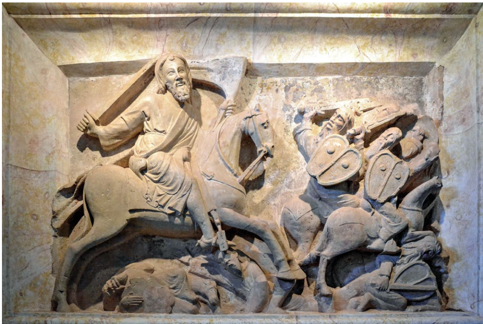
Fig. 8. Retábulo de Santiago Matamouros. Séc. XIV. Igreja matriz de Santiago do Cacém.

A primeira fonte escrita que refere esta obra data de 1517, e reveste-se de grande importância pelas informações que veicula 21 . É a descrição de uma Visitação da Ordem Santiago, isto é, uma informação cerca de 200 anos posterior à cronologia que também identificamos para a realização da obra (1. a metade do século XIV). Esta