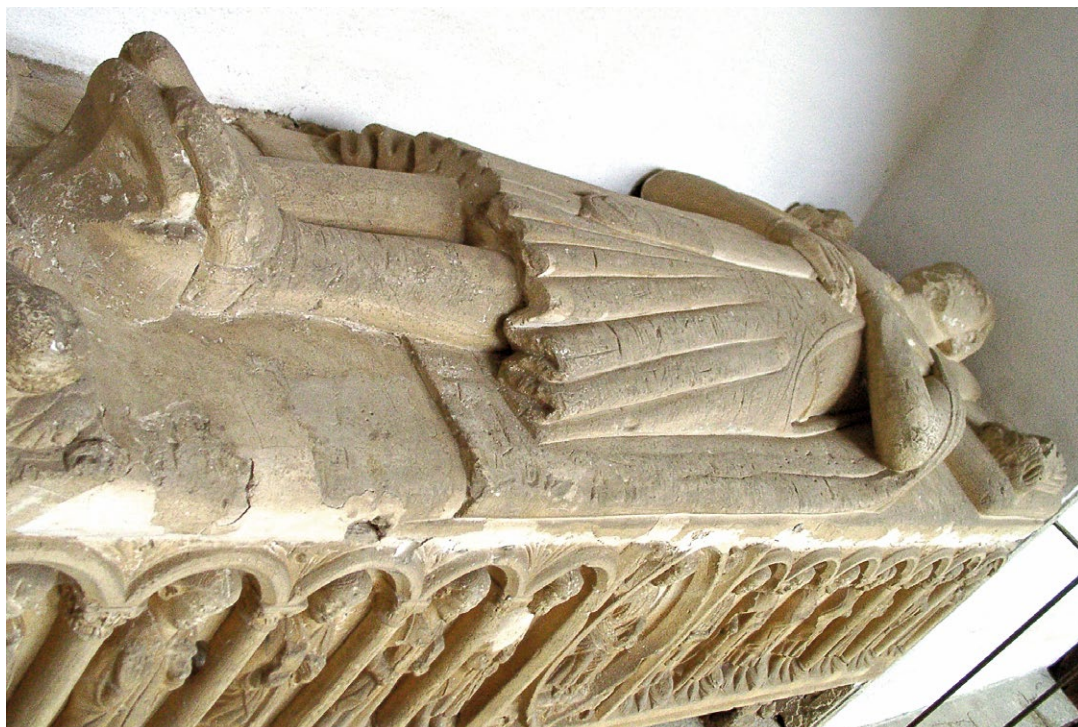
Fig. 1. Sepulcro de D. Rodrigo Sanches. Ca. 1345-47. Mosteiro de S, Salvador de Grijó.