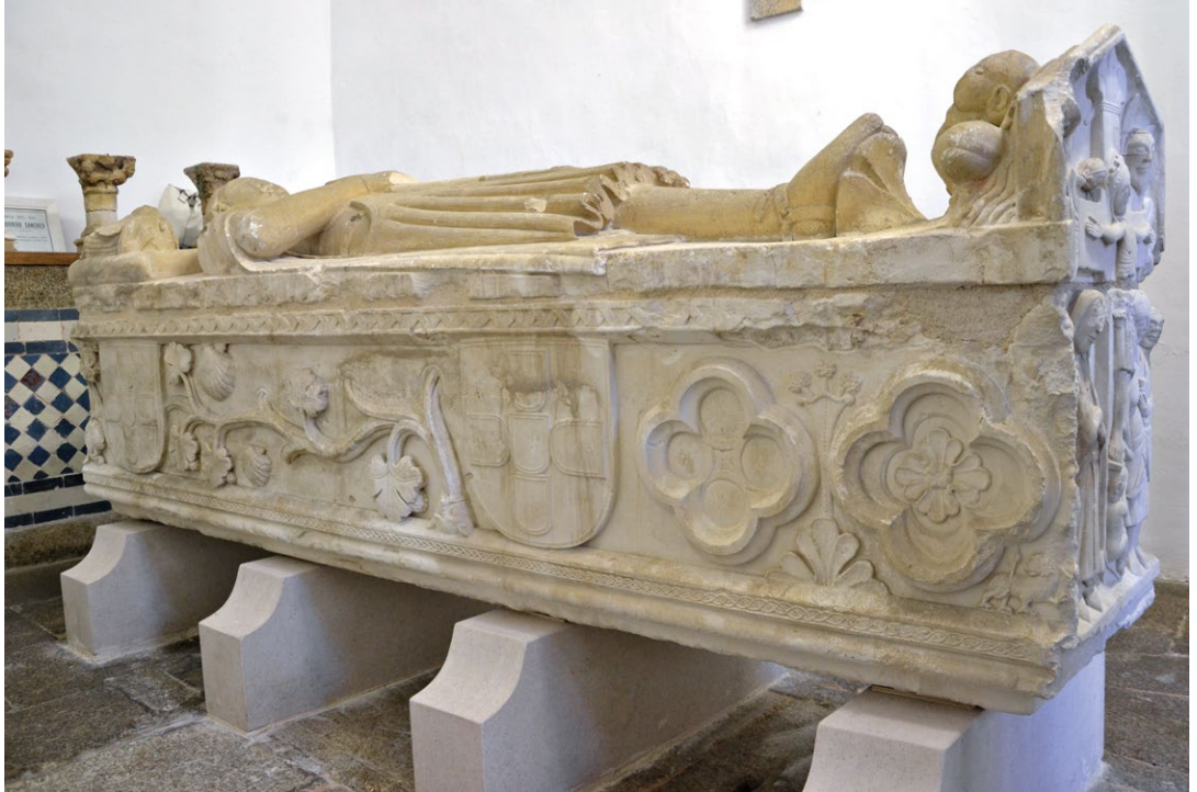
Fig. 3. Face longa do sepulcro de D. Rodrigo Sanches, com heráldica, hastes, folhas e vieiras.

zoomórficos). Estas vieiras, de grande formato e volume, não poderiam ter sido escolhidas, entre a iconografia possível para este sarcófago, se não tivessem um conteúdo simbólico relevante. A vieira isolada é, nestes tempos, um símbolo inequívoco dos peregrinos e das peregrinações a Santiago de Compostela. Sabemos hoje, com base noutros exemplos analisados e já publicados, que alguns peregrinos se que a presença da vieira, associada a contextos funerários, assumia também um valor apotropaico e salvífico, símbolo material de uma crença de que, desse modo, quando ressuscitassem no dia do Juízo Final teriam consigo esse fortíssimo argumento: o de ter peregrinado a Compostela 6 . Recordemos o peregrino que vemos na fila dos bem-aventurados na cena do Juízo Final do portal da Catedral de Autun (ca. 1130), e, em Portugal, a presença desse elemento tão distintivo, na escarcela de peregrina jacobea do jacente da rainha Isabel de Aragão (Rainha Santa Isabel) 7 . Este elemento – inédito na escultura funerária medieval portuguesa até essas datas – trouxe um valor acrescido à iconogra-