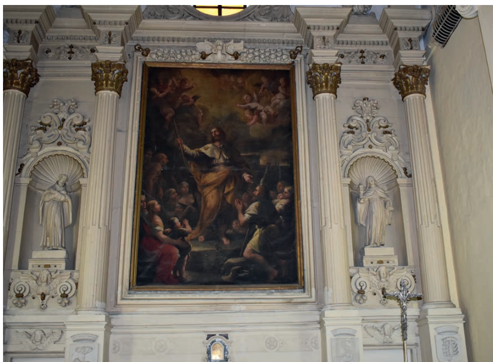
Fig. 8. Giuseppe Simonelli (attr.), La predica di San Giacomo . Lecce, chiesa di San Giacomo.