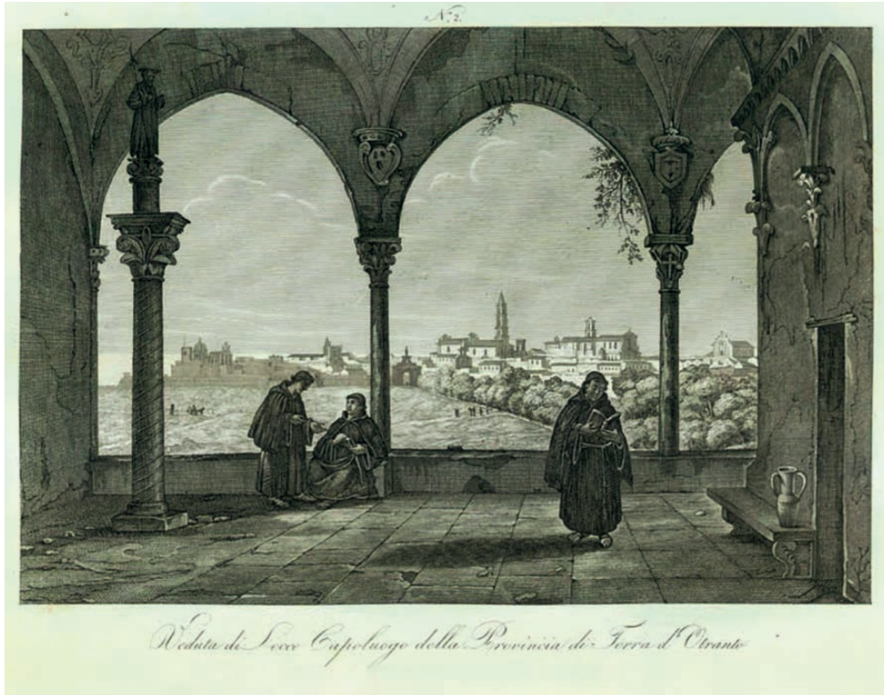
Fig. 9. Francesco Wenzel, Veduta di Lecce dal chiostro di San Giacomo .

Conventuali Riformati, detti Barbanti, nel 1614, quando Filippo III d'Asburgo affidò loro il complesso, riservando alla Corona di Spagna il patronato sulla chiesa, poi agli Alcantarini, nel 1671, per intercessione del viceré Pietro d'Aragona.