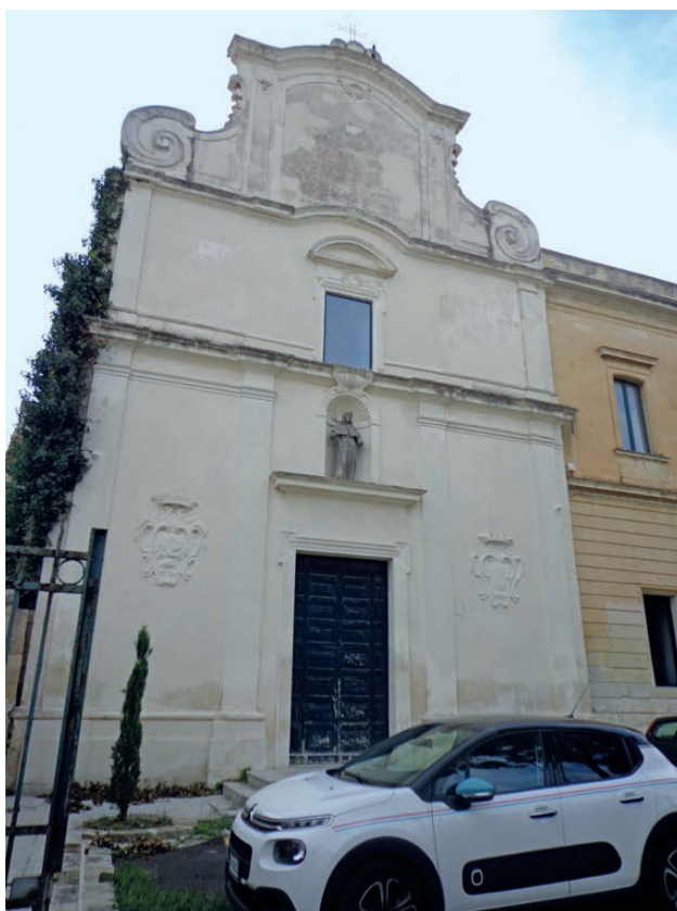
Fig. 4. Lecce, chiesa di San Giacomo, facciata.