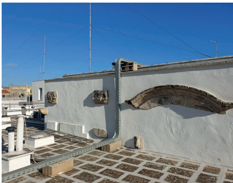
Fig. 2. Brindisi, caserma della Guardia di Finanza, decorazioni della facciata della chiesa di San Francesco di Paola, XVIII secolo.