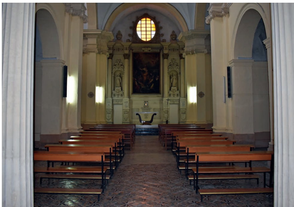
Fig. 7. Lecce, chiesa di San Giacomo, interno (foto Nicola Cleopazzo).