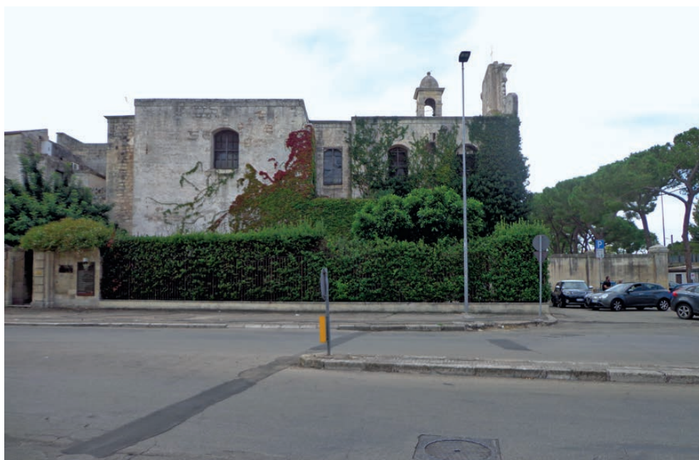
Fig. 5. Lecce, chiesa di San Giacomo, fianco.