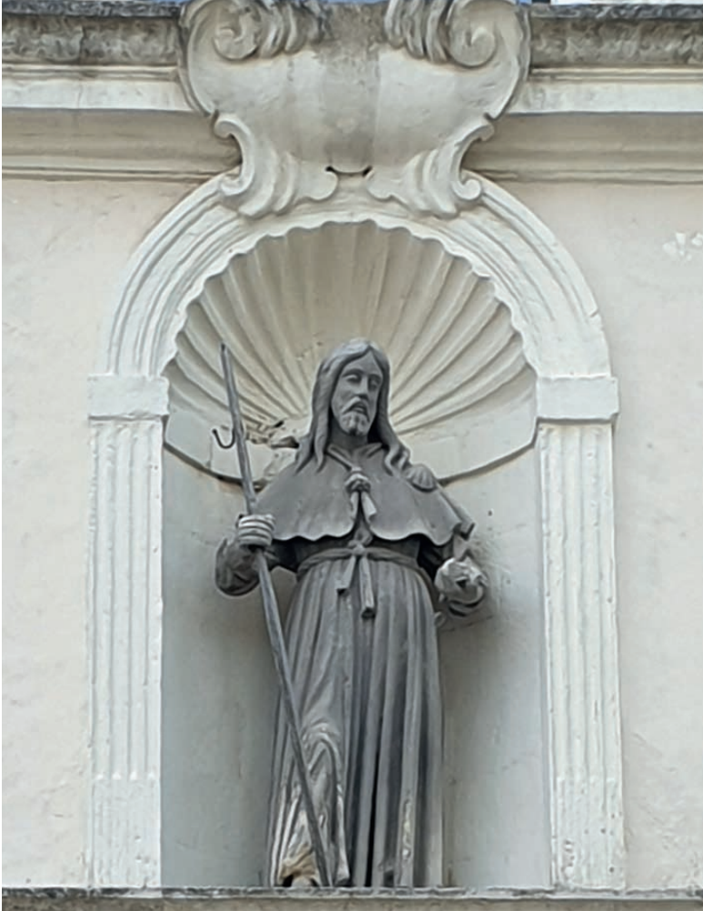
Fig. 6. Lecce, chiesa di San Giacomo, facciata, San Giacomo pellegrino.

L'importanza della chiesa nella geografia del potere urbano è confermata anche dall'aver accolto dal 14 giugno al 9 luglio 1684 la prima statua di Sant'Oronzo, patrono della città di Lecce, proveniente da Venezia, prima che venisse collocata con solenni cerimonie sulla colonna nella piazza leccese 25 .