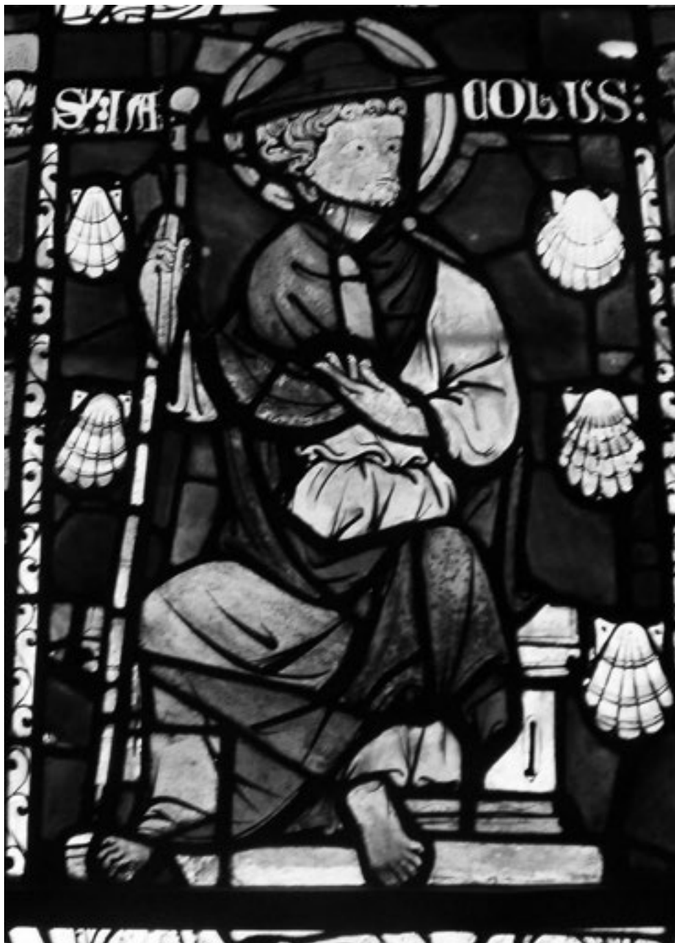
Imagen del apóstol Santiago con la concha como símbolo. Capilla de los Cuatro Apóstoles del Castillo de Rouen, ca. 1270.