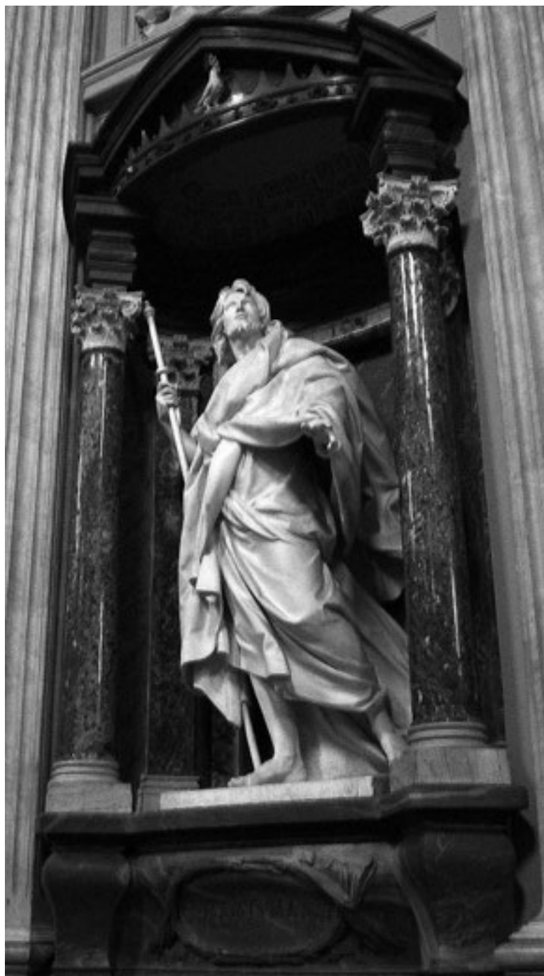
El apóstol Santiago en la basílica de San Juan de Letrán, en Roma, uno de los centros de poder del pontificado romano.